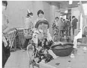
ピンボールゲーム