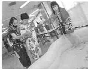
お菓子釣りゲーム