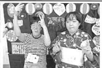
フォトスポットの前で