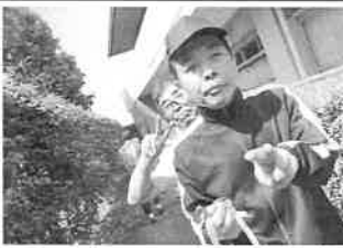
午後 紐探し(レクレーション)