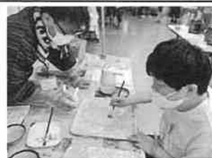
らくがきせんべい作り