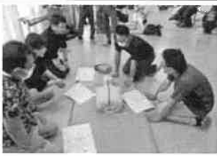
職員 救急法講習会 8/18・9/15