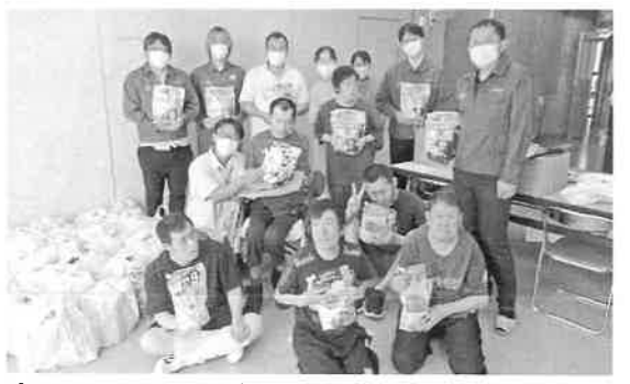
ピー・アンド・ジー(株)様より沢山の洗剤用品を頂きました

厳しい暑さがようやく終わり、秋の季節になってきました。新型コロナウイルス感染症が完全に収まったわけではありませんが、当施設でもようやく日帰り外出を始めました。利用者、職員共々とても楽しむことができました。やはり出かけられるのはいいものです。今後も、様々なことを試みていければと思います。