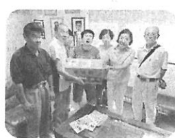
おいしい梨を頂きました。