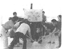
小野地区民児協「劇」いつも楽しませてもらっています。