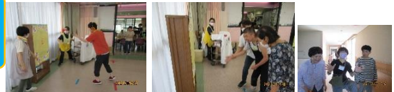
楽しく遊んだ後は・・・特別なおやつも食べました♡