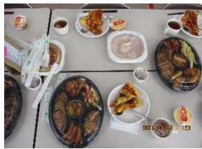
特別なランチタイム