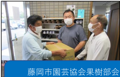
藤岡市園芸協会果樹部会より 梨を頂きました。