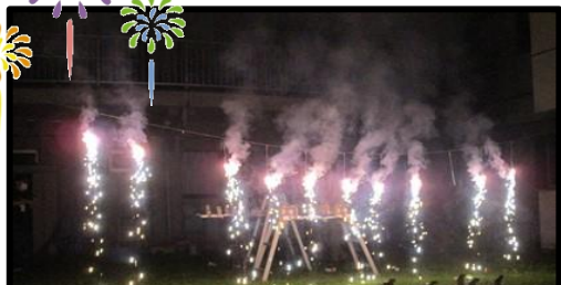
かなの里の中庭で花火大会を行いました。