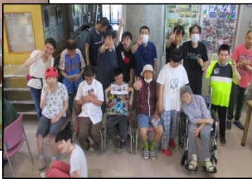
8月の誕生日昼食メニューは、 ブラジル風ライス♪ 誕生日を皆でお祝いしました！