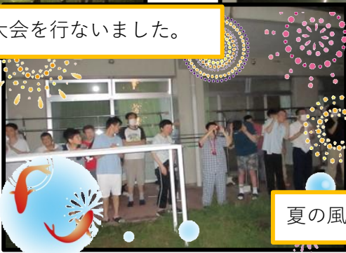
夏の風物詩として楽しみました。